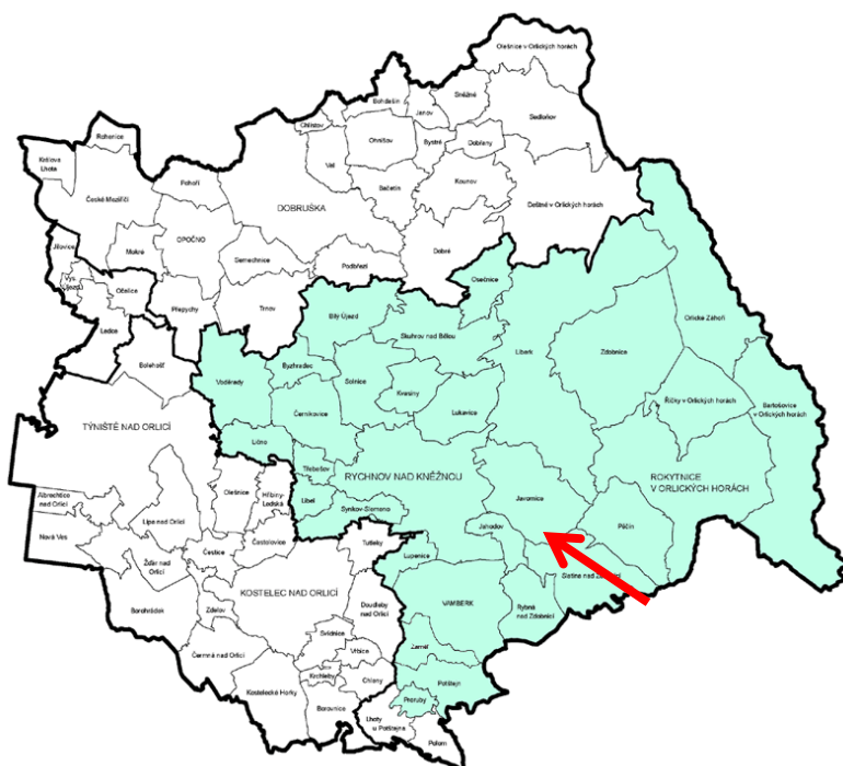
Obrázek 4: Území DSO Mikroregionu Rychnovsko

DSO Mikroregion Rychnovsko má v současné době 30 členských obcí.