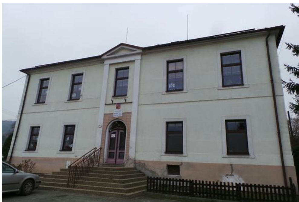
Obrázek 3: Základní a mateřská škola v Rybné nad Zdobnicí

Základní a mateřská škola je vybavena školní jídelnou a školní družinou.