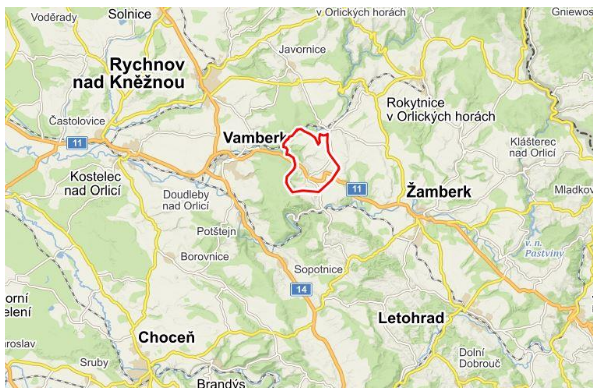
Obrázek 1: Poloha obce Rybná nad Zdobnicí

Obec Rybná nad Zdobnicí sousedí s obcemi Slatina nad Zdobnicí, Záchlumí, Helvíkovice a městem Vamberk. Okresní město Rychnov nad Kněžnou je vzdálené přibližně 15 km.