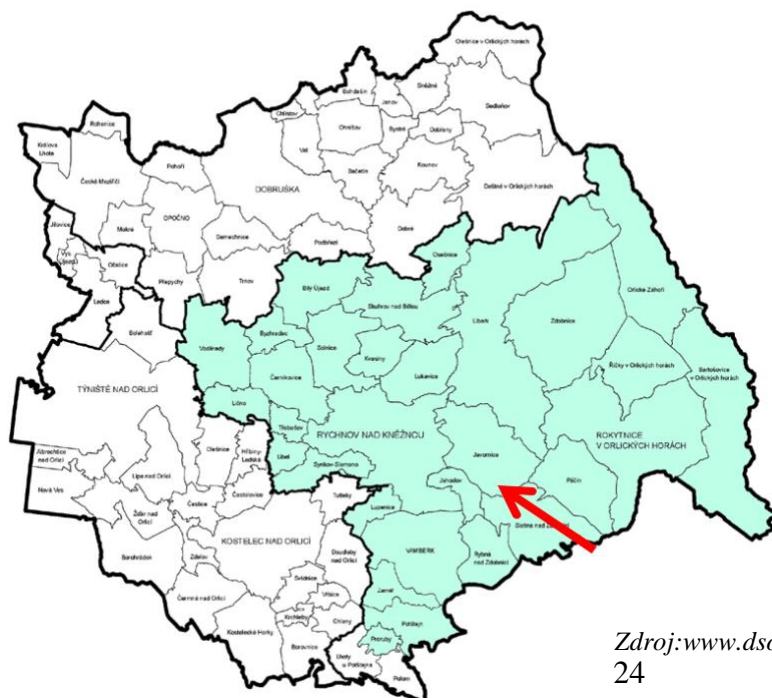
Obrázek 4: Území DSO Mikroregionu Rychnovsko

DSO Mikroregion Rychnovsko má v současné době 30 členských obcí.