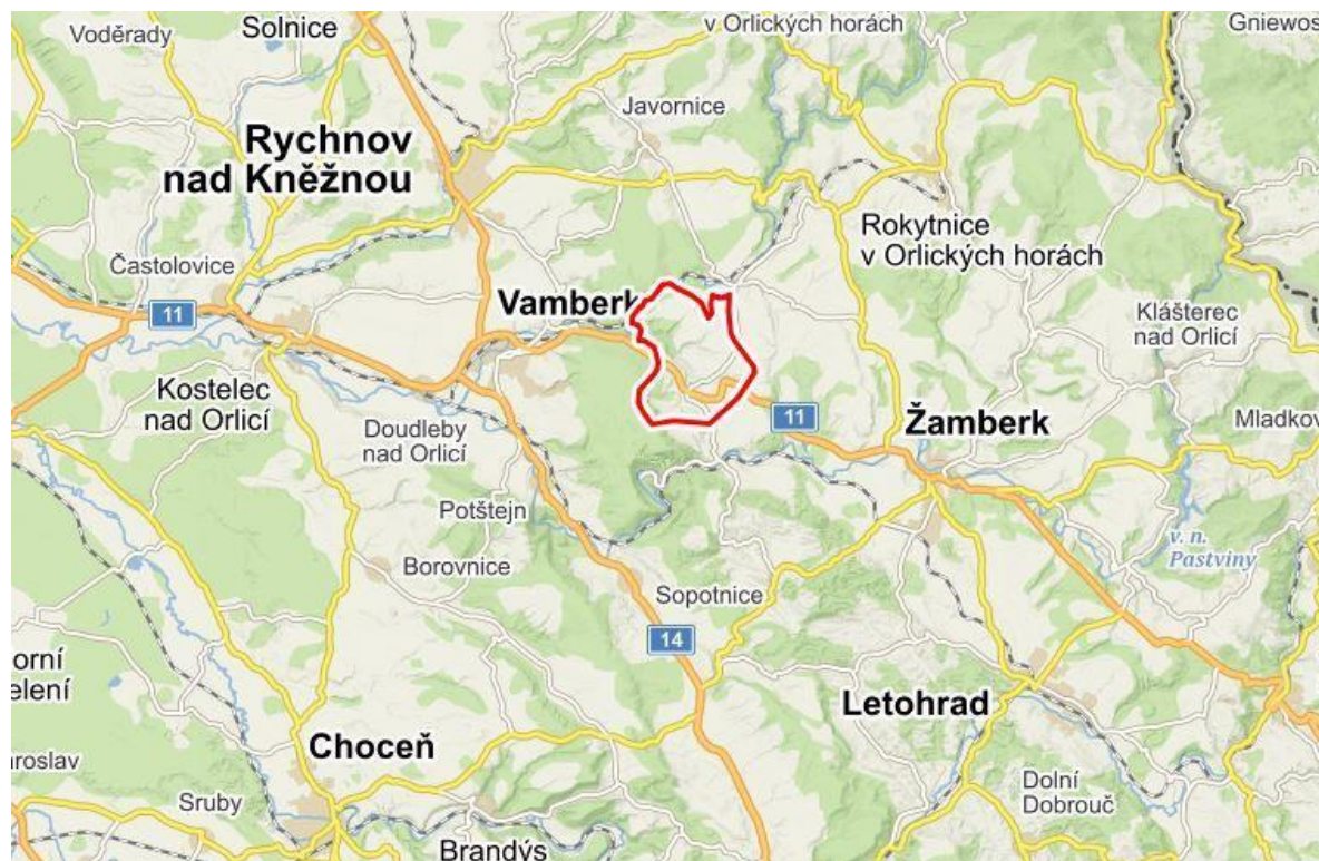
Obrázek 1: Poloha obce Rybná nad Zdobnicí

Obec Rybná nad Zdobnicí sousedí s obcemi Slatina nad Zdobnicí, Záchlumí, Helvíkovice a městem Vamberk. Okresní město Rychnov nad Kněžnou je vzdálené přibližně 15 km.